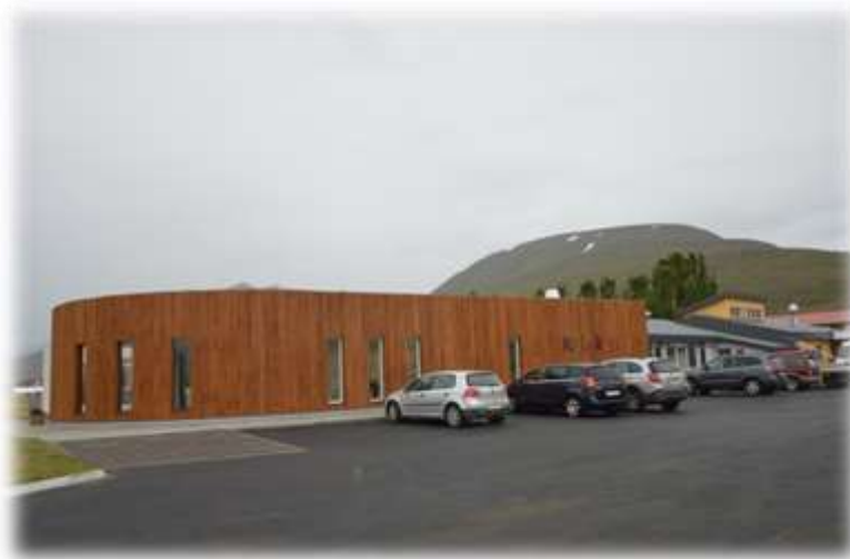
Krílakot í ágúst 2016

Krílakot Karlsrauðatorgi 23 4604950 krilakot@dalvik.is www.dalvik.is/krilakot