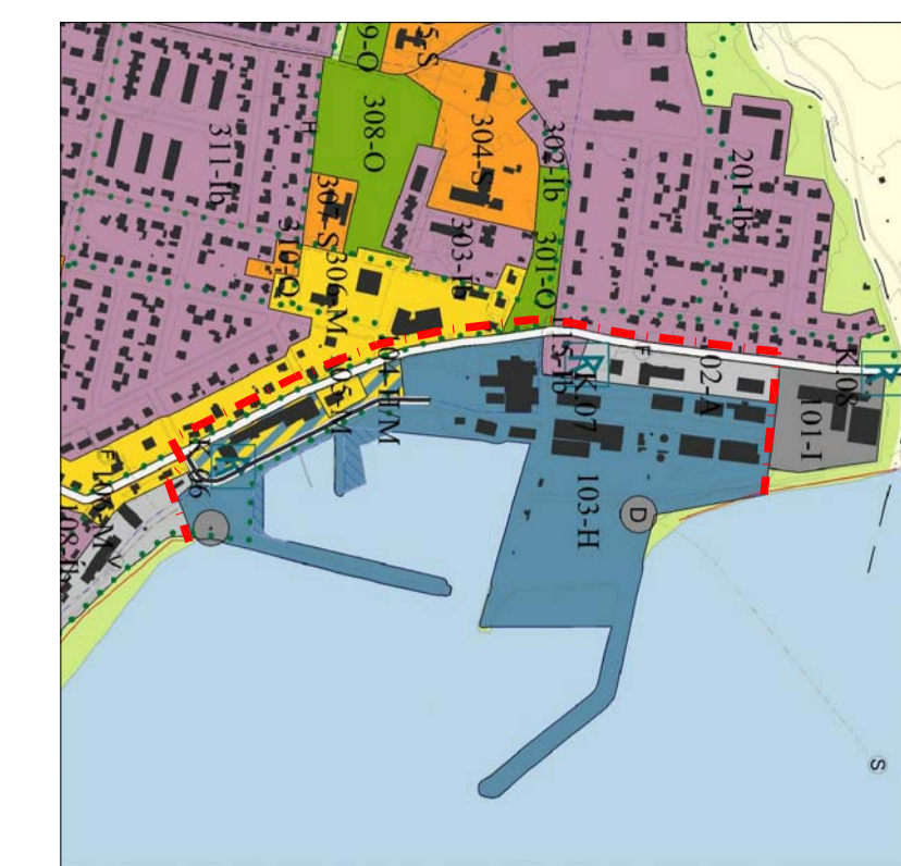
Áðalskipulag Dalvíkur 2008 - 2020 - mkv. 1:10.000

Deiliskipulagstillaga þessi sem auglýst hefur verið samkvæmt 1. mgr. 25. gr. skipulags- og byggingarlaga nr. 73/1997, frá _____ 2010. Athugasemdafrestur var til _____ 2010. var samþykkt í Umhverfisráð Dalvíkurbyggðar þann _____ 2010 og bæjarstjórn Dalvíkurbyggðar _____ 2010.