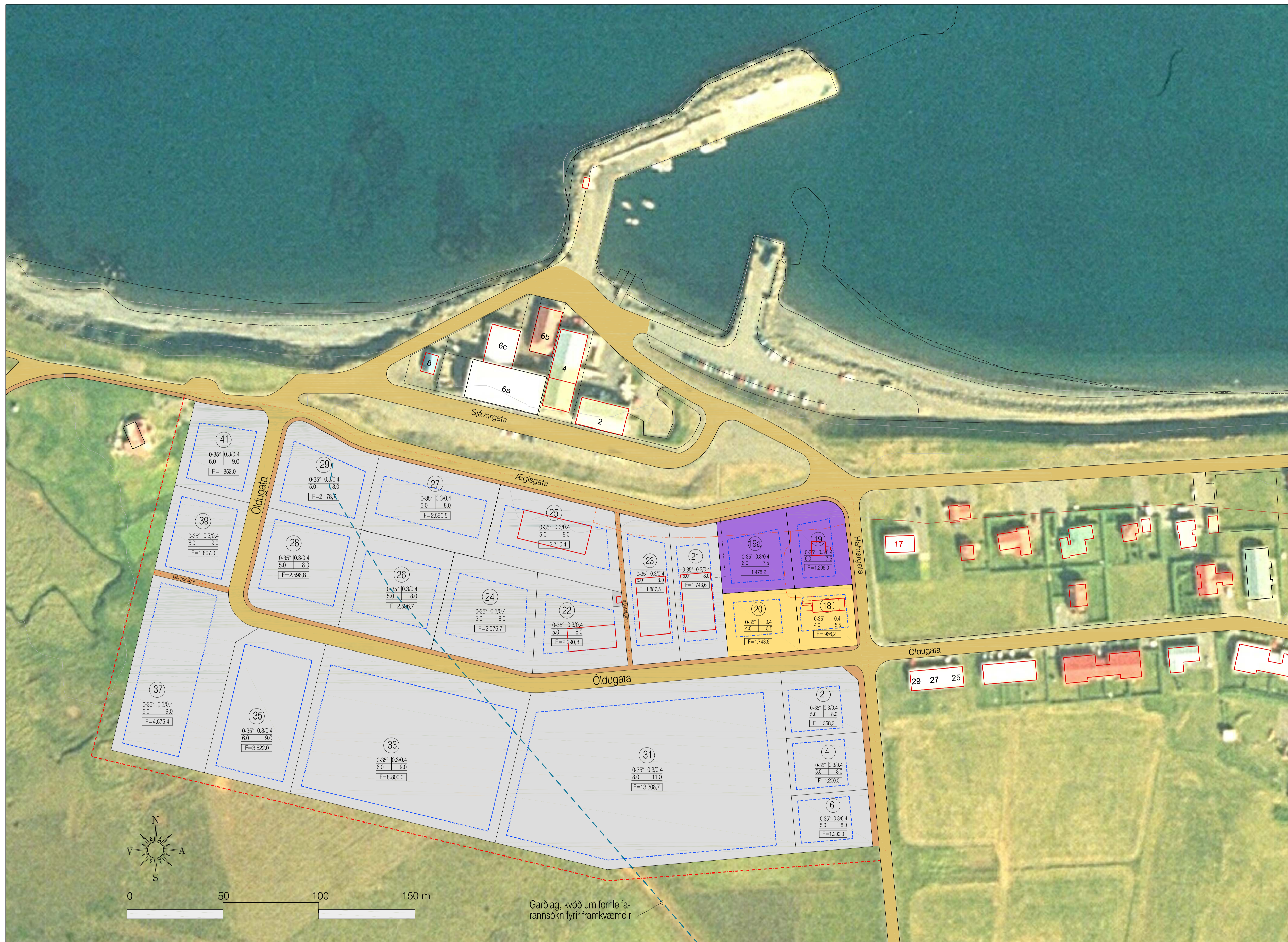
Deiliskipulagstillaga - mkv. 1:1000