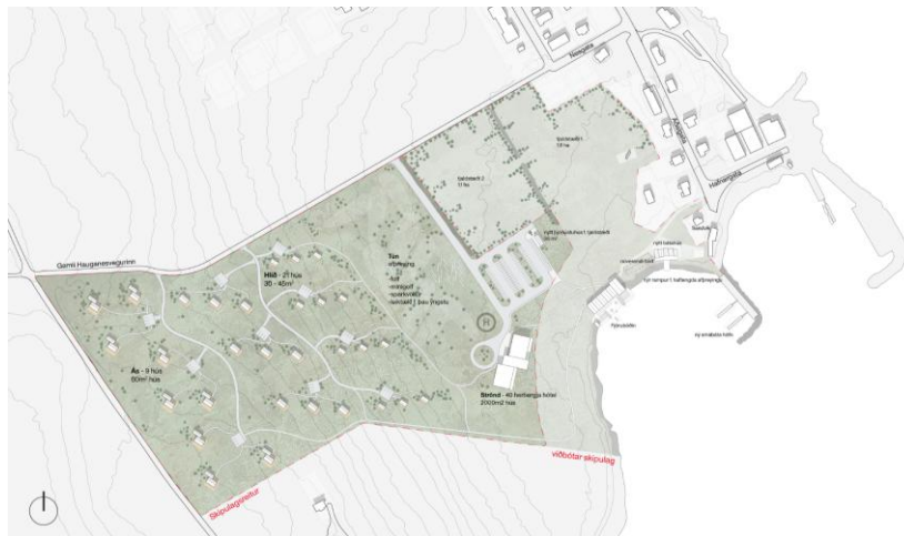
Mynd 1 Tillaga að uppbyggingu og þróun svæðisins samkvæmt hugmyndaleit haustið 2023

Haustið 2023 efndi Dalvíkurbyggð til hugmyndaleitar þar sem kallað var eftir tillögum að uppbyggingu og þróun á svæðinu.