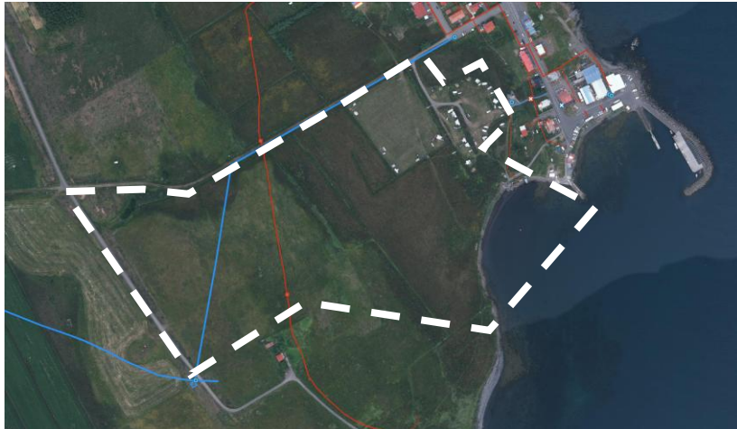
Mynd 3 Vatns og hitaveitulagnir táknaðar bláar og rauðar. Afmörkun skipulagssvæðisins sýnd með brotalínu. Heimild www.map.is/dalvik

Vatns- og hitaveitulagnir liggja að hluta til yfir skipulagssvæðið, þvert á túnin. Hitaveitulögn liggur frá tjaldsvæðinu að Fjöruböðunum, engin fráveita liggur um svæðið. Við mótun skipulagsins verður haft samráð við hlutaðeigandi aðili varðandi veitur og aðra innviði.