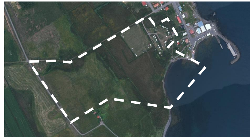
Mynd 2 Afmörkun skipulagssvæðisins sýnd með brotalínu.

Breyting þessi kemur að mestu til framkvæmdar á svæðinu vestan við tjaldsvæðið og á svæðinu við Fjöruböðin.