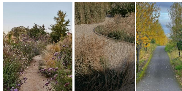
Dæmi um mismunandi yfirborðsefni á stígum og gróðri meðfram.

Gert er ráð fyrir góðum göngutengingum á svæðinu. Við hönnun stíga skal tekið mið af algildri hönnun, þar sem því verður komið við skal halli gönguleiða ekki vera meiri en 5%. Gert er ráð fyrir að hjólandi vegfarendur deili stígakerfi með gangandi vegfarendum.