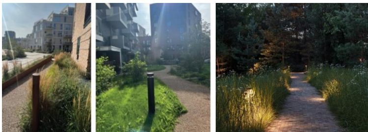
Dæmi um lágstemmda lýsingu við stíga.

Auk götu- og veglýsingar skulu stígar, dvalar- og afþreyingarsvæði búnin vandaðri lágstemmdri lýsingu og leitast við að nota lága staura/polla fremur en háa ljósastaura. Samræma skal útlit lampa og staura fyrir svæðið og notast skal við búnað sem lágmarkar glýju, hefur góða litarendurgjöf og hámarks nýtni.