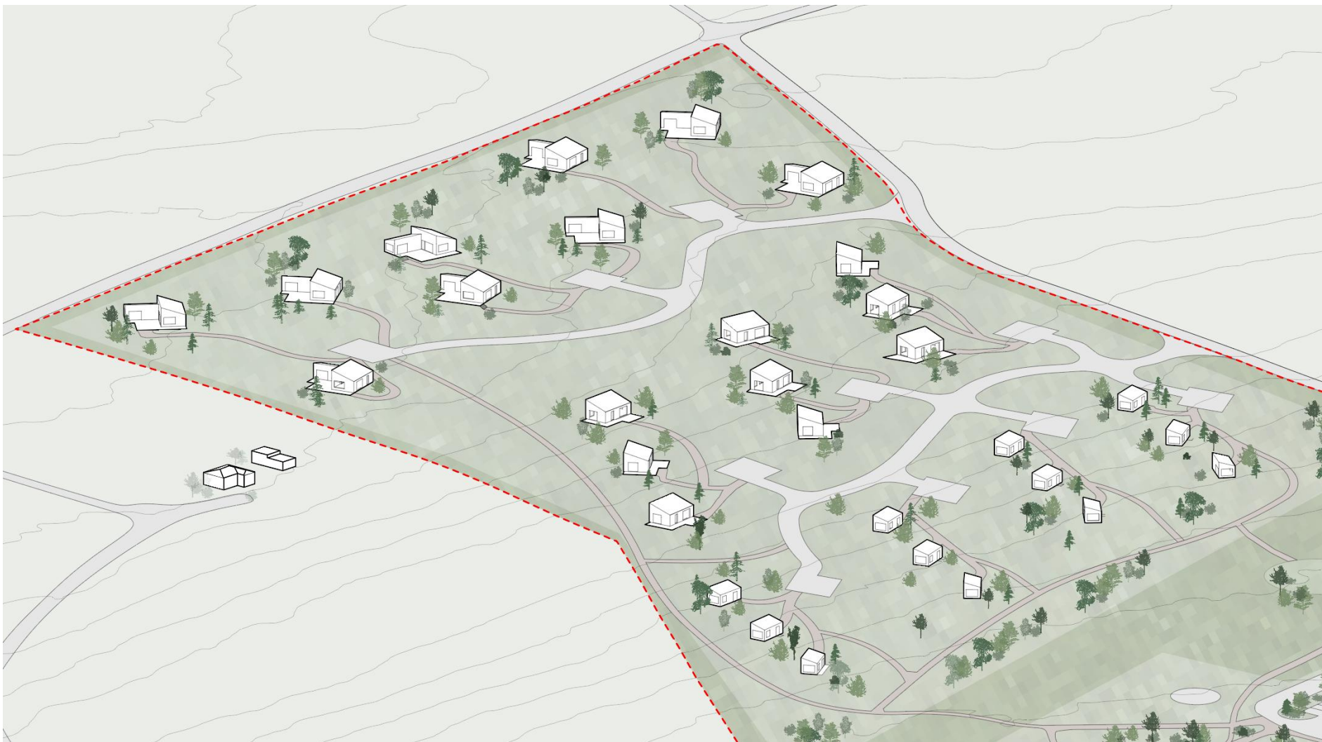
Skýringarmynd. Sýnir mögulega uppröðun og umfang frístundahúsa