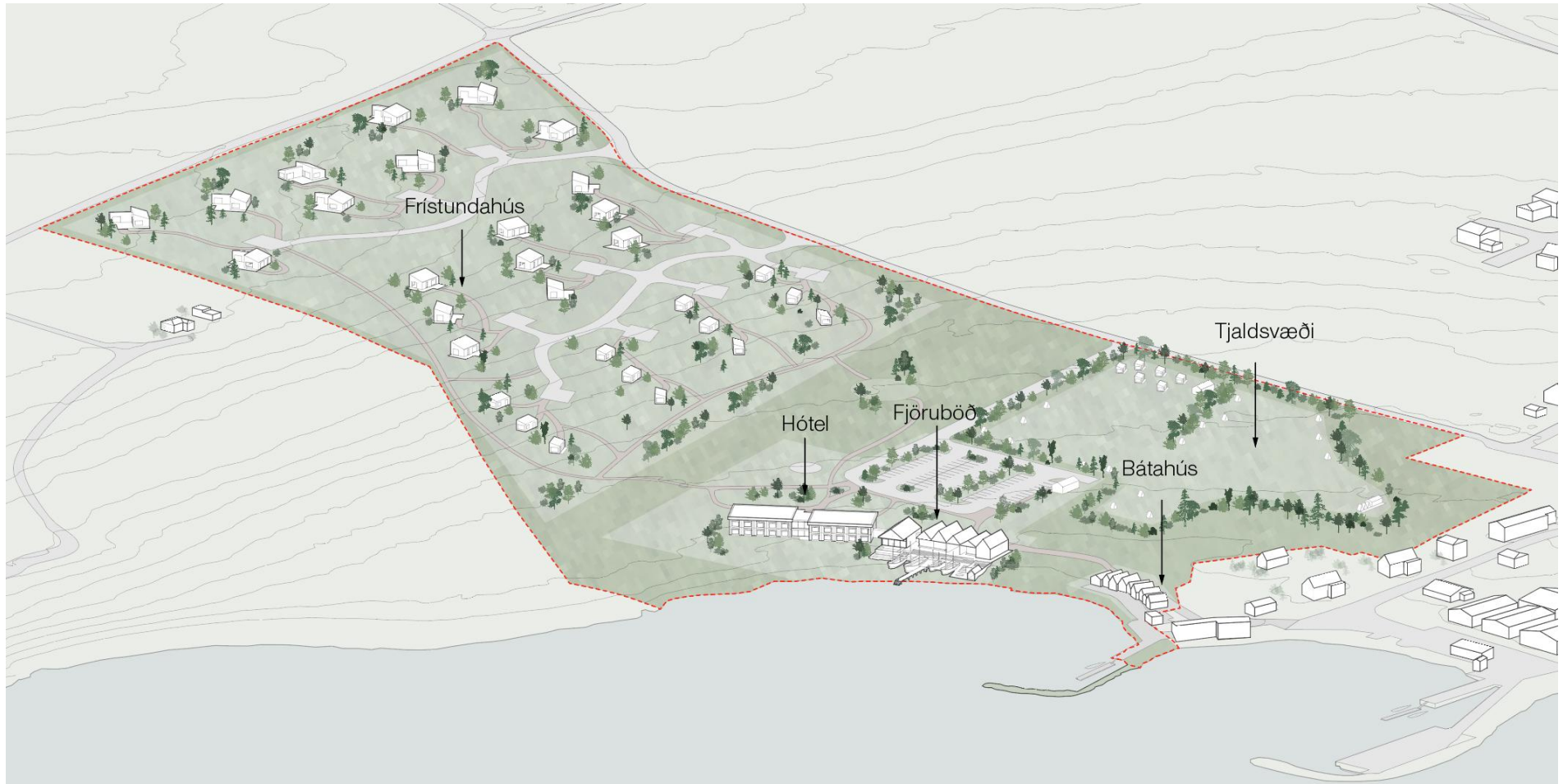
Skýringarmynd. Yfirlitsmynd yfir skipulagssvæðið